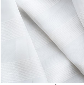
3141R FOLK Blanc 01