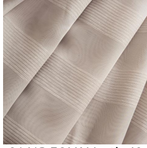
3141R FOLK Mastic 48