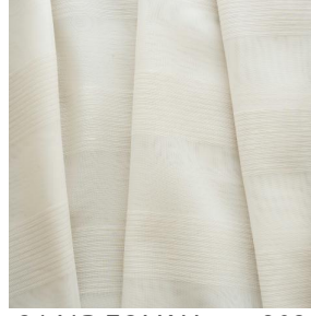
3141R FOLK Nacre 203