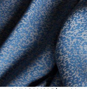
ANNONAY Bleu 41