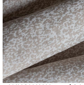
ANNONAY Naturel 26