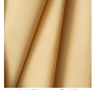
BIOTAM Maïs 37