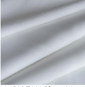
BIOTAM Blanc 01