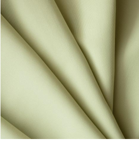
BIOTAM Absinthe 132