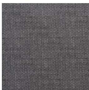
COMET OSIER 2300 Poivre 181