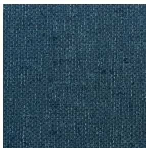
COMET OSIER 2300 Tempête 179