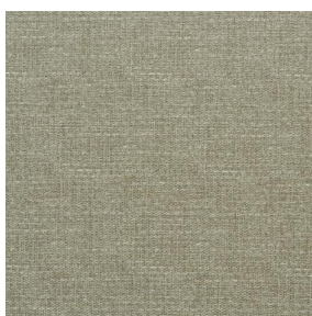
COMET OSIER 2300 Lin 11