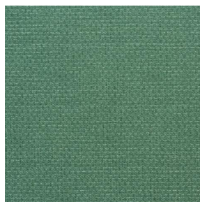
COMET OSIER 2300 Romarin 176