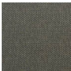
COMET OSIER 2300 Etain 180