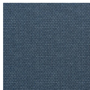
COMET OSIER 2300 Minéral 157