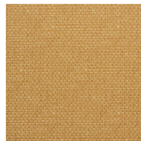
COMET OSIER 2300 Miel 17