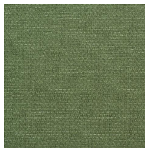
COMET OSIER 2300 Fenouil 177