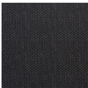
COMET OSIER 2300 Truffe 189