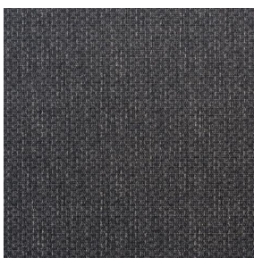
COMET OSIER 2300 Ardoise 87