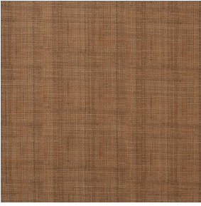
COMET RAPHIA 2351 Osier 171