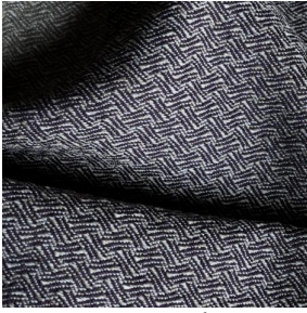
GLAMIS Sisal 140