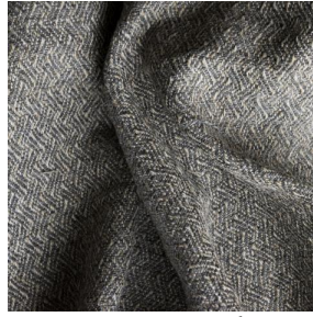
GLAMIS Naturel 26