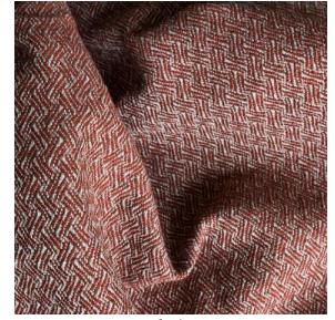
GLAMIS Châtaigne 55