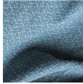
GLAMIS Jade 116