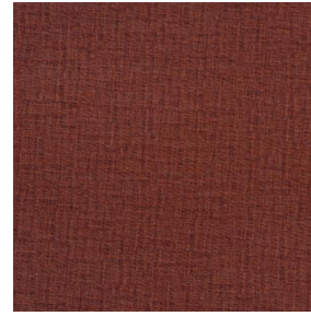
LY MURA 2334 Grenat 56