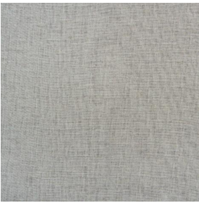
LY MURA 2334 Ivoire 115