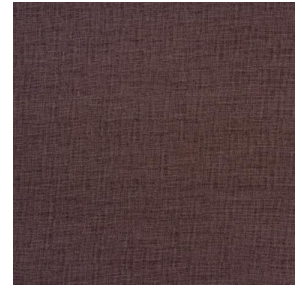
LY MURA 2334 Terre 107