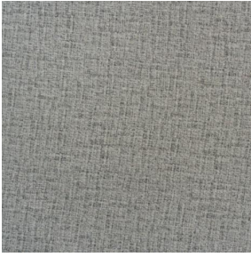
LY MURA 2334 Mastic 48