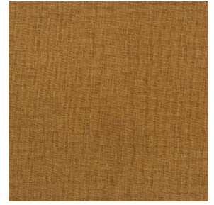
LY MURA 2334 Savane 185