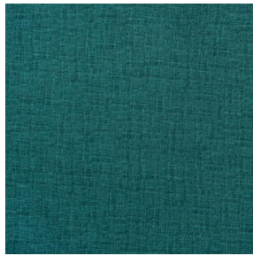
LY MURA 2334 Turquoise 53