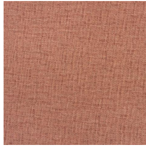
LY MURA 2334 Rose 129