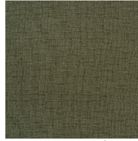
LY MURA 2334 Olive 61