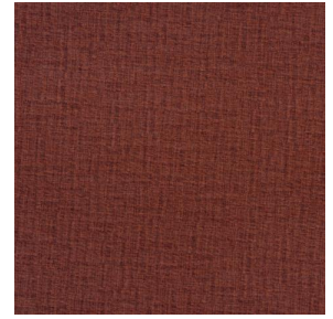
LY MURA 2334 Grenat 56