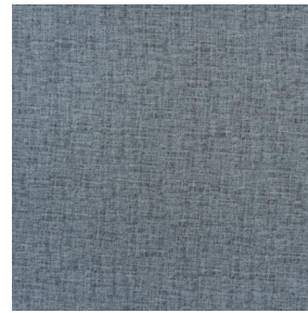
LY MURA 2334 Minéral 157