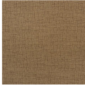
LY MURA 2334 Dune 170