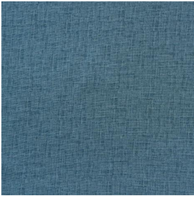
LY MURA 2334 Glacier 43