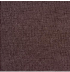
LY MURA 2334 Terre 107