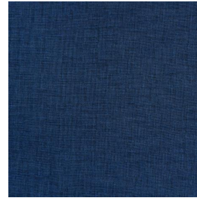
LY MURA 2334 Saphir 106