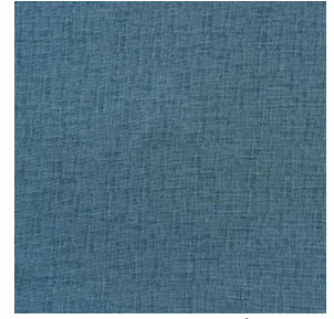
LY MURA 2334 Glacier 43