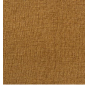
LY MURA 2334 Savane 185