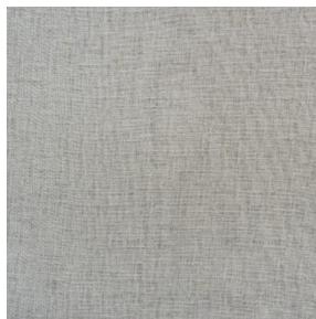
LY MURA 2334 Ivoire 115