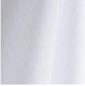
M102 Blanc 01