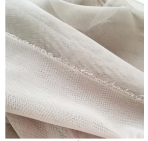
M102 lin 11