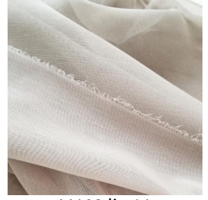
M102 lin 11