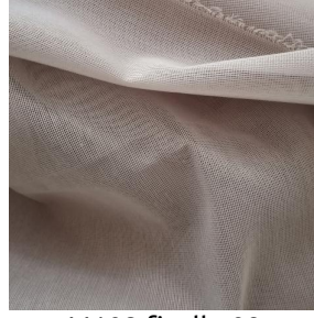
M102 ficelle 09