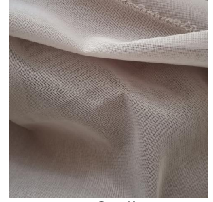
M102 ficelle 09