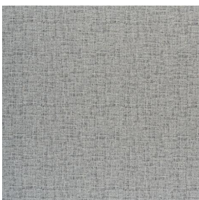
NOCLIN MURA 2334 Minéral 157