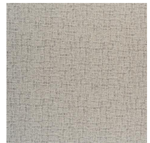
NOCLIN MURA 2334 Mastic 48