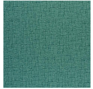
NOCLIN MURA 2334 Turquoise 53