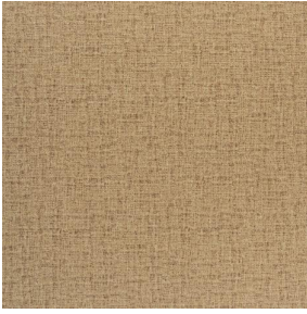
NOCLIN MURA 2334 Dune 170