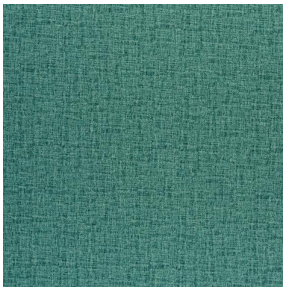
NOCLIN MURA 2334 Turquoise 53