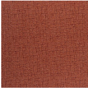
NOCLIN MURA 2334 Grenat 56