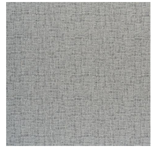
NOCLIN MURA 2334 Minéral 157