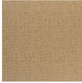
NOCLIN MURA 2334 Dune 170