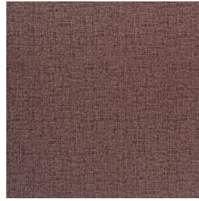
NOCLIN MURA 2334 Terre 107