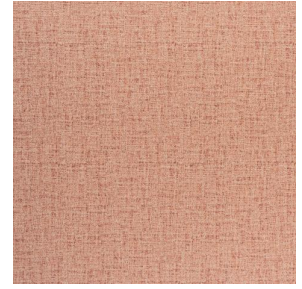
NOCLIN MURA 2334 Rose 129