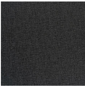
NOCLIN MURA 2334 Fusain 71