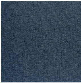
NOCLIN MURA 2334 Saphir 106