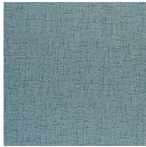
NOCLIN MURA 2334 Glacier 43