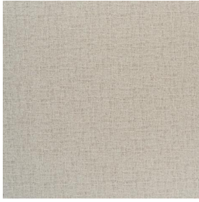
NOCLIN MURA 2334 Ivoire 115