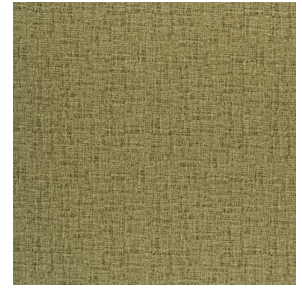
NOCLIN MURA 2334 Olive 61