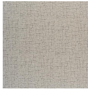
NOCLIN MURA 2334 Mastic 48