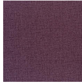
NOCLIN MURA 2334 Cassis 97