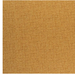
NOCLIN MURA 2334 Savane 185