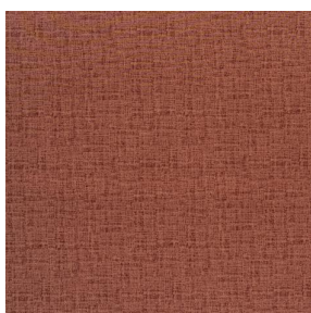
NOCTURNE MURA 2334 Grenat 56