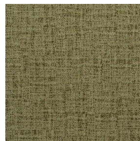
NOCTURNE MURA 2334 Olive 61