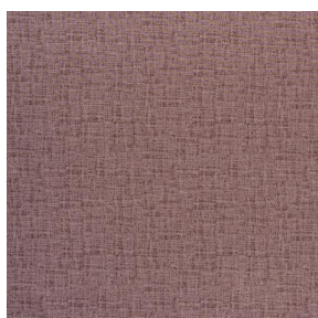
NOCTURNE MURA 2334 Terre 107