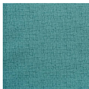
NOCTURNE MURA 2334 Turquoise 53