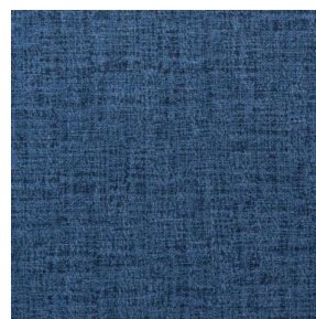
NOCTURNE MURA 2334 Saphir 106