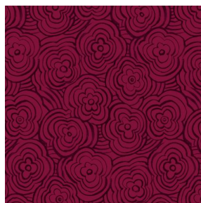
ONDES Opéra 104