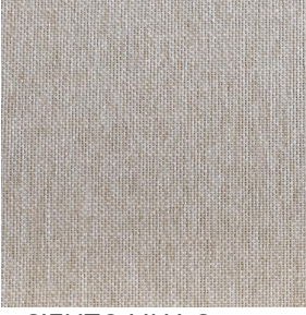
SIENTO LINA Savane 185