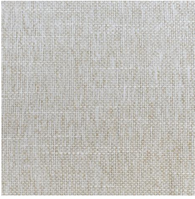
SIENTO LINA Dune 170