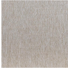
SIENTO LINA Savane 185