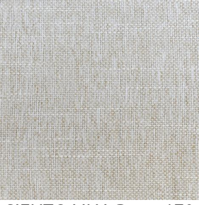
SIENTO LINA Dune 170