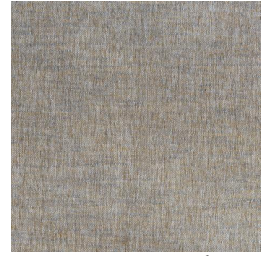
SIENTO LITO Cordage 172