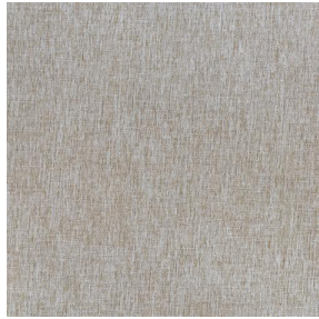
SIENTO LITO Lin 11