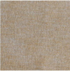
SIENTO LITO Sahara 169