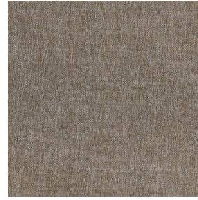
SIENTO LITO Brousse 192