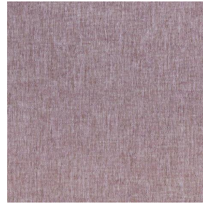
SIENTO LITO Hortensia 134