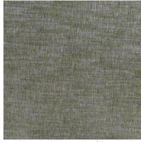
SIENTO LITO Lichen 156