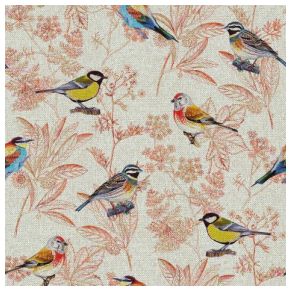
SIENTO RECYCLE DESSIN 2205 OISEAUX Orange 15