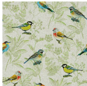
SIENTO RECYCLE DESSIN 2205 OISEAUX Mousse 92