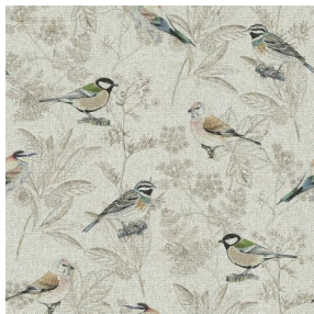
SIENTO RECYCLE DESSIN 2205 OISEAUX Naturel 26