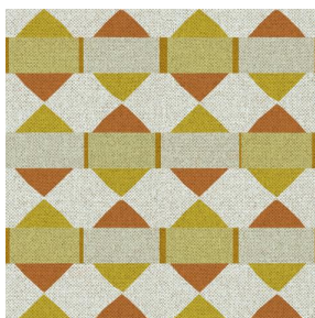
SIENTO RECYCLE DESSIN 2208 POP Or 94