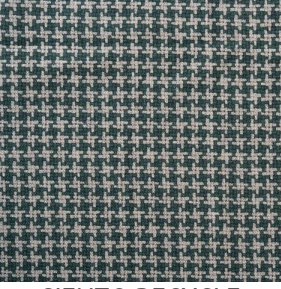
SIENTO RECYCLE TELISE 2339 Sapin 126