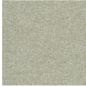
SIENTO RECYCLE UNI Lin 11