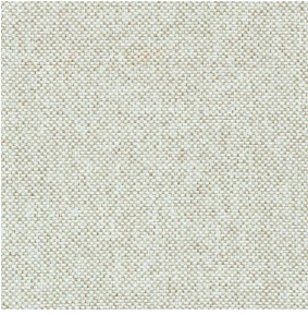
SIENTO RECYCLE UNI Naturel 26