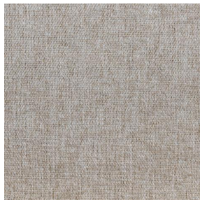
SIENTO WOODY Osier 171