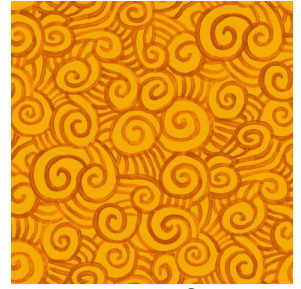
TUMULTE Safran 49