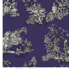
ZELIE Prune 84