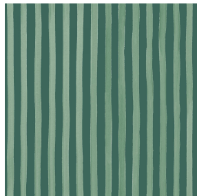
SONG Sapin 126 Motif d'impression