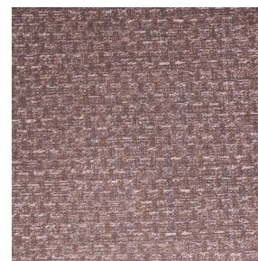
RUSTIC Terre 107