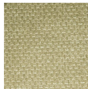
RUSTIC Bergamote 121