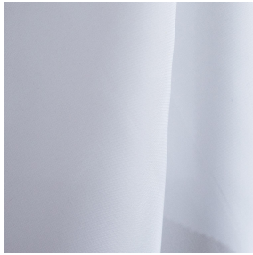
3141 bpi 00 Support d'impression