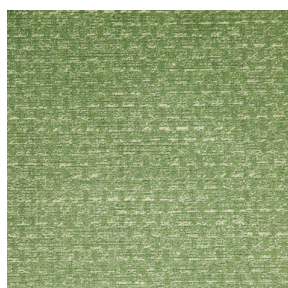
RUSTIC Mousse 92