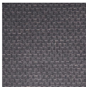
RUSTIC Titanium 98