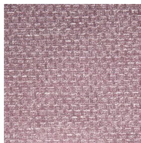
RUSTIC Sienne 29