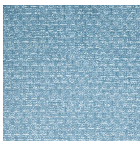
RUSTIC Glacier 43