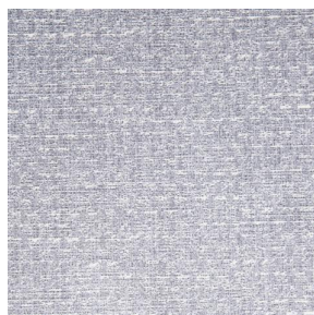
RUSTIC Lin 11