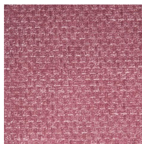
RUSTIC Hortensia 134