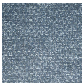
RUSTIC Bleu 41