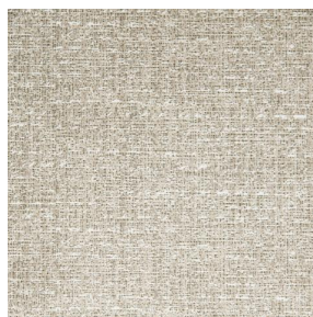
RUSTIC Naturel 26