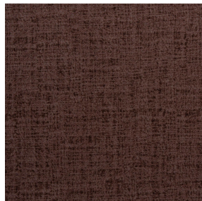
MURA TERRE 107 Motif d'impression