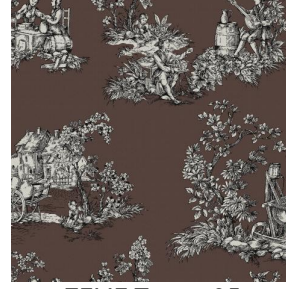
ZELIE Taupe 95