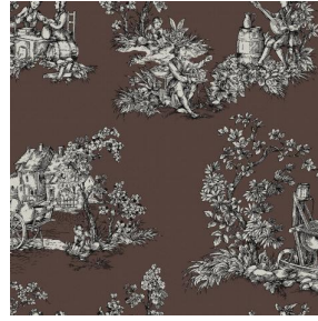
ZELIE Taupe 95