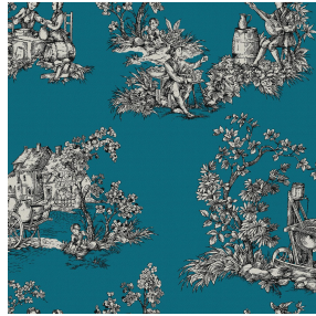
ZELIE Céladon 135 Motif d'impression