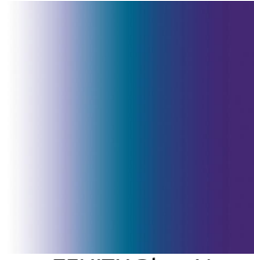
ZENITH Bleu 41