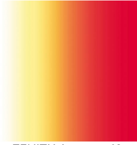
ZENITH Agrume 69