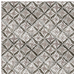
PIETRO Ficelle 09 Motif d'impression