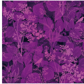
ODE Lilas 19 Motif d'impression