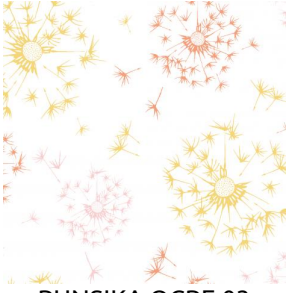
PUNSIKA OCRE 03