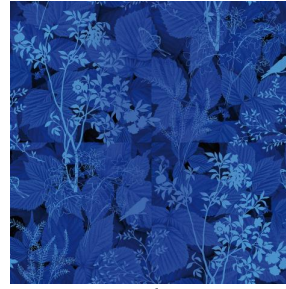
ODE Bleu 41