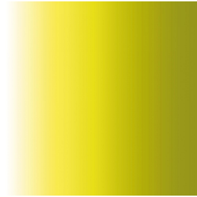
ZENITH Anis 62 Motif d'impression