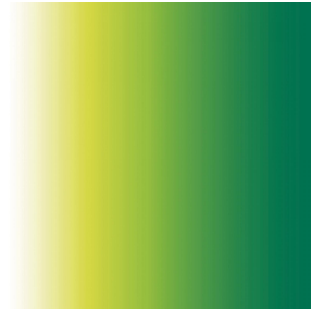
ZENITH Cactus 36 Motif d'impression