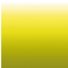
ZADIG Anis 62 Motif d'impression