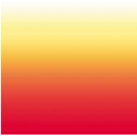
ZADIG Agrume 69