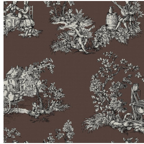
ZELIE Taupe 95 Motif d'impression