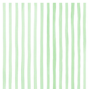
SONG Tilleul 103