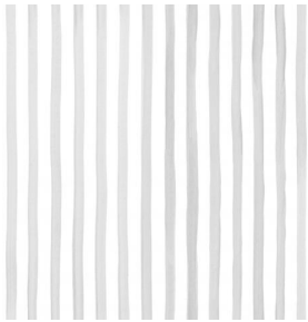
SONG Naturel 26