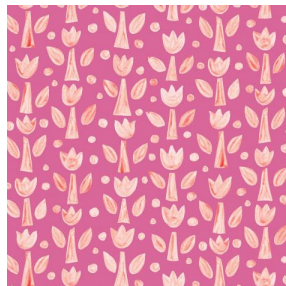
TULIPE Rose 129