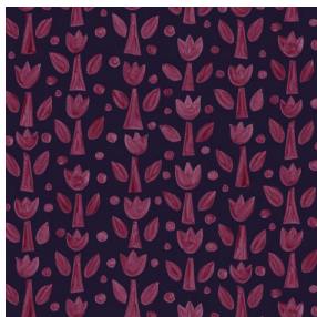
TULIPE Bordeaux 04