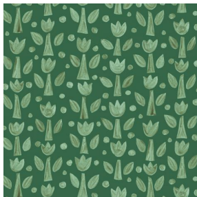
TULIPE Lierre 124