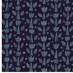
TULIPE Nuit 128 Motif d'impression