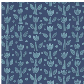
TULIPE Indigo 119