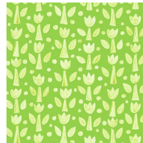
TULIPE Anis 62