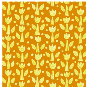
TULIPE Soleil 127