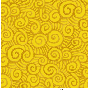
TUMULTE Mais 37